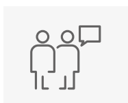
Beratung vor Ort