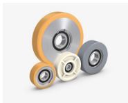
Förder-/Führungs- und Kugelrollen