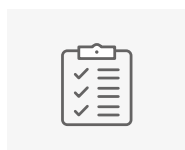
großes Standard- sortiment/Lager