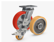
Räder, Lenk-/Bock- und Schwerlastrollen